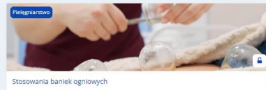
Stosowania baniek ogniwych