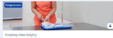
Kropelowy wlew dożylny