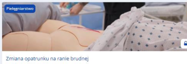
Zmiana opatrunku na ranie brudnej