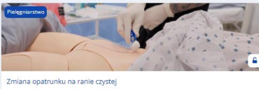
Zmiana opatrunku na ranie czystej

Dostęp do filmów instruktażowych i materiałów dydaktycznych