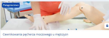
Cewnikowanie pęcherza moczowego u mężczyzn